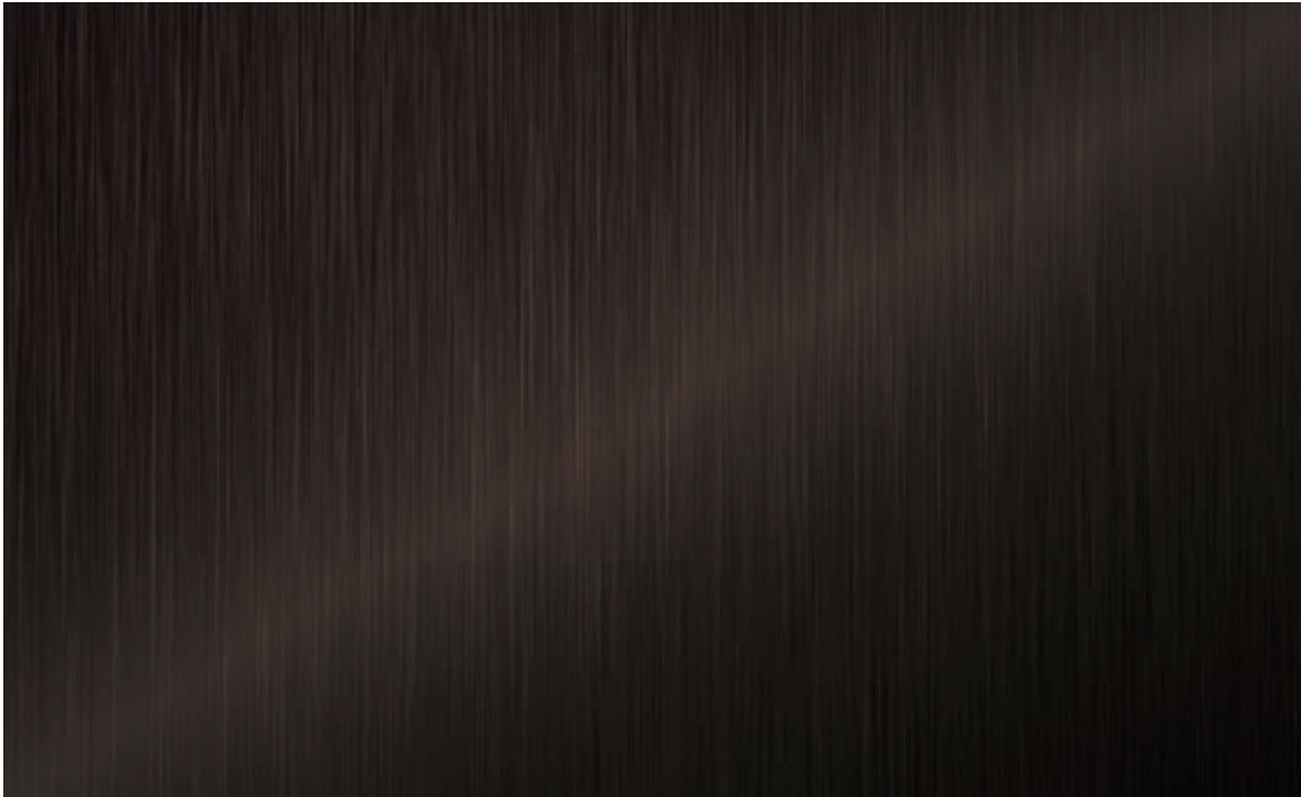
Brushed Bronze 80 | DE AB0480