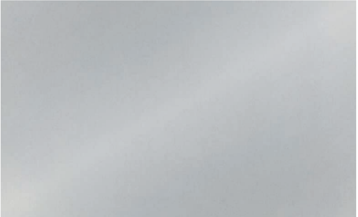
Mill Natural | DE AM0102