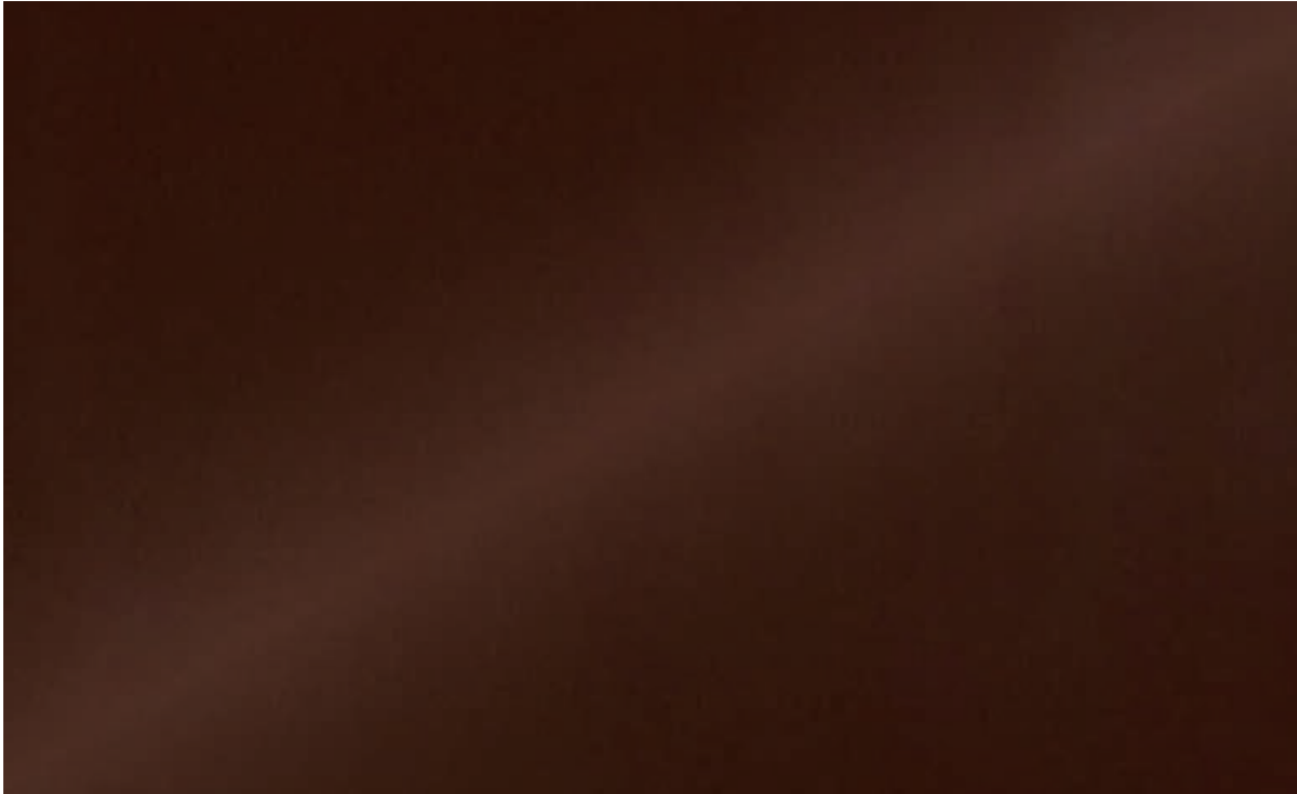
Mill Copper 50 | DE AM0350