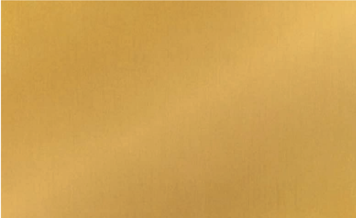
Mill Gold 40 | DE AM0240