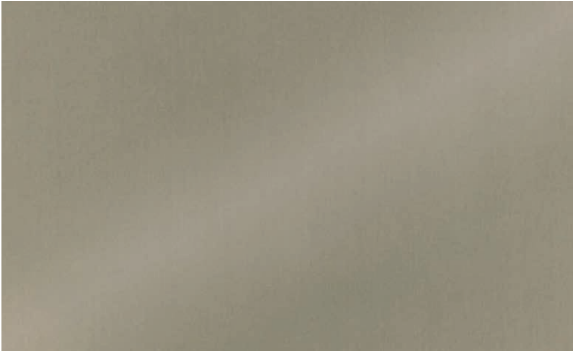
Mill Bronze 30 | DE AM0430